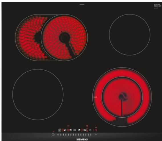
Table de cuisson vitrocéramique - HighSpeed - 60 cm Design à facettes