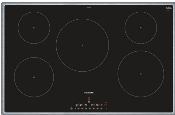
Table de cuisson vitrocéramique à induction - 80 cm Cadre Design en inox