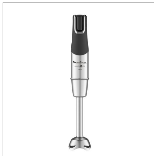
HBL INFINYFORCE PRO DD95HD10 MOULINEX - MIXEUR PLONGEUR INFINYFORCE PRO 4-EN-1 DD95HD10